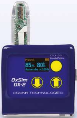
Ox-2 Sim Flex